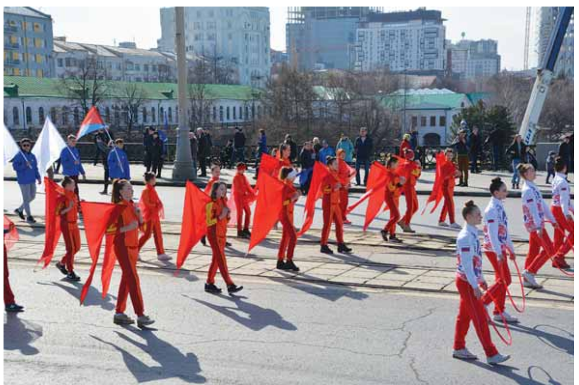
На фото: «коробка» спортсменов в Екатеринбурге.

ятий – концерты, спортивные и танцевальные соревнова-