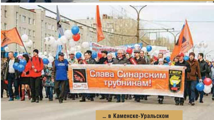
... в Каменске-Уральском