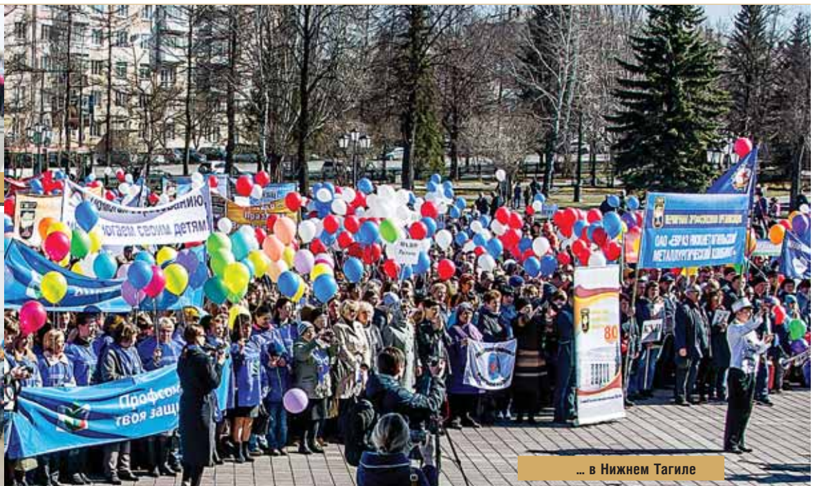
... в Нижнем Тагиле