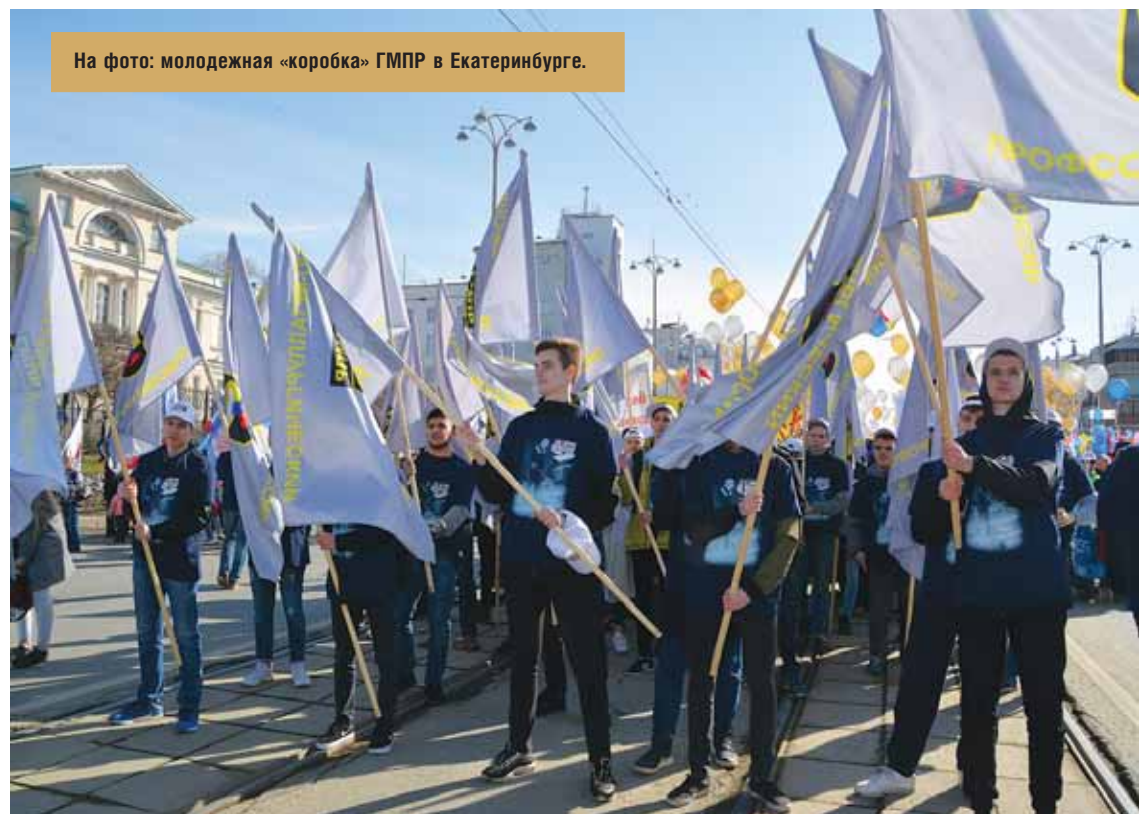
На фото: молодежная «коробка» ГМПР в Екатеринбурге.

В своем выступлении профгруппорг ГМПР отметил, что сегодня мы живем в очень напряженное время. На нашу промышленность западный мир накладывает абсолютно незаконные и несправедливые санкции. Западные политики утверждают, что российская экономика разорвана в ключья.