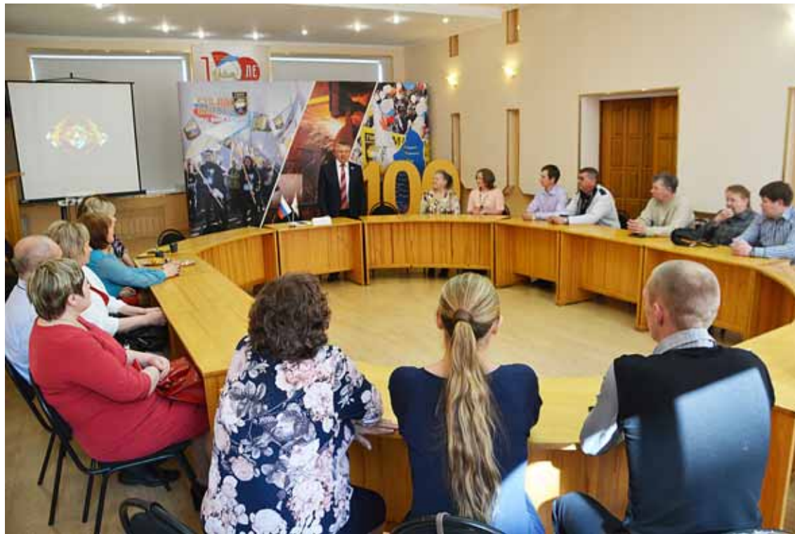
На фото: перед слетом представители династий ГМК региона традиционно собрались в Свердловском обкоме ГМПР

Участниками IV областного слета трудовых династий стали представители лучших се-