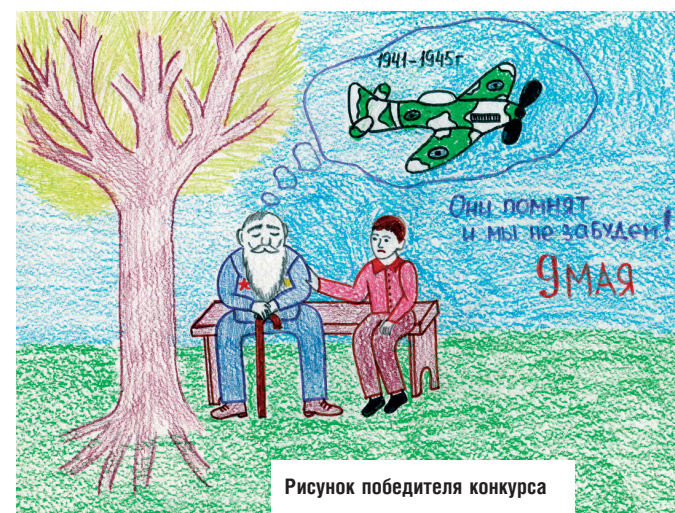
Рисунок победителя конкурса