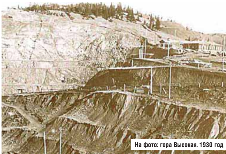
На фото: гора Высокая. 1930 год