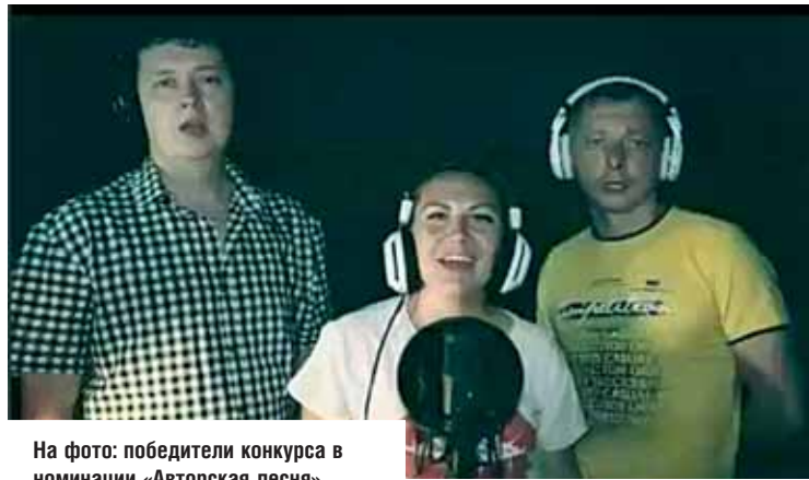
На фото: победители конкурса в номинации «Авторская песня»

Номинаций в конкурсе было две – «Авторская песня» - для тех, кто пишет и стихи, и музыку, и «Авторский текст на известную мелодию», где можно было написать лишь стихи и