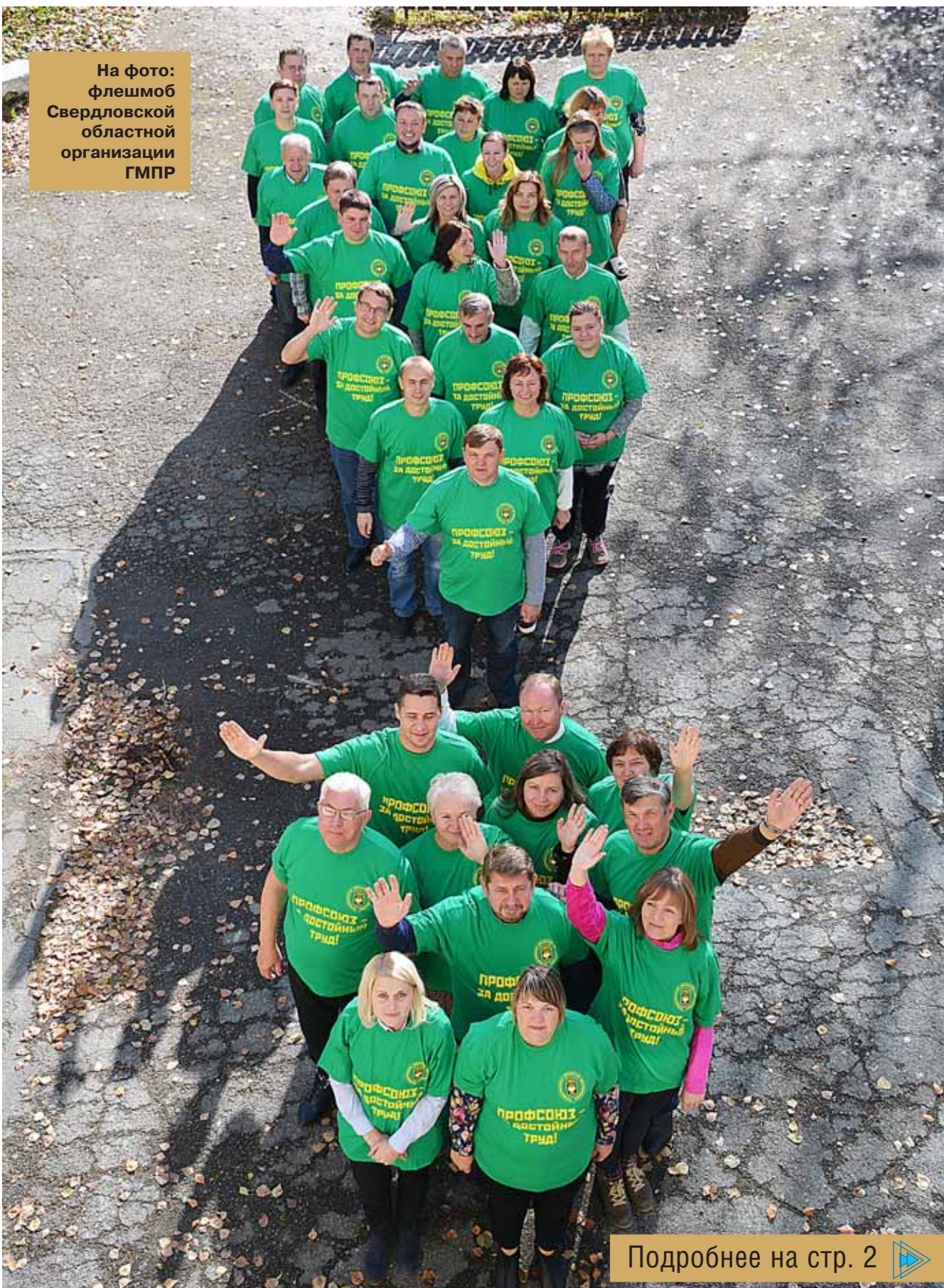
На фото: флешмоб Свердловской областной организации ГМПР

Федерация Независимых Профсоюзов России отметила Всемирный день действий «За достойный труд!» 7 октября. Он учрежден Международной конфедерацией профсоюзов (МКП) в ответ на глобальное наступление капитала на права человека труда. В понятие «достойный труд» глобальные профсоюзы включают, прежде всего, устойчивый экономический рост, который бы гарантировал каждому человеку качественное рабочее место; достойную заработную плату; безопасные условия труда; справедливый уровень социальной защиты.